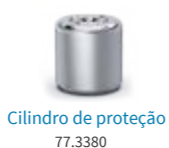
Cilindro de proteção 77.3380