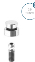
Pilar O'ring 72.3704

* Cápsula não acompanha o produto. Código cápsula: 2.4001