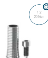
Pilar titânio (UCLA) 77.3511 77.3512