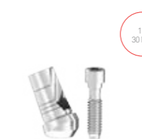
Munhão angulado 25° Altura Perfil Cód. 1 25 2.2531N 2 25 2.2532N 3 25 2.2533N