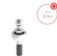
Munhão o'ring Altura Cód. 1 2.3341 2 2.3342 3 2.3343 4 2.3344 5 2.3345