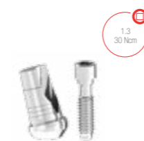
Munhão angulado 15° Altura Perfil Cód. 1 15 2.1531N 2 15 2.1532N 3 15 2.1533N