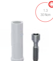
Ucla calcinável 3.3301 3.3302