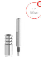
Transfer mold aberta 9.3301