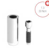
Pilar CrCo 5.3501T