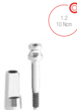
Transfer mold fechada 9.3300