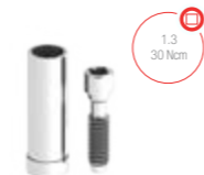
Munhão reto Altura Perfil Cód. 1 3.3 5.3312