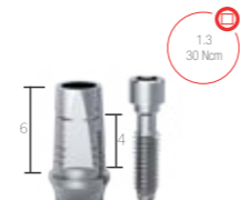
Munhão anatômico Altura Perfil Cód. 1 4 4.3301L 2 4 4.3302L 3 4 4.3303L