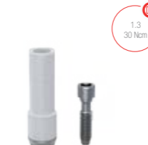
Pilar base CrCo 5.3501 5.3502