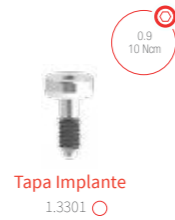
Tapa Implante 1.3301