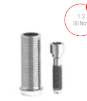
Pilar titânio 5.3310 5.3410