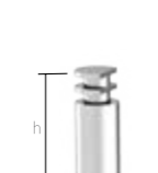
Transfer SLIM Altura (h) Cód. 4 4.3490i 6 4.3390i