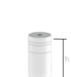
Cápsula calcinável Altura (h) Cód. 4 4.3410i 4 4.3410M 6 4.3310i 6 4.3310M